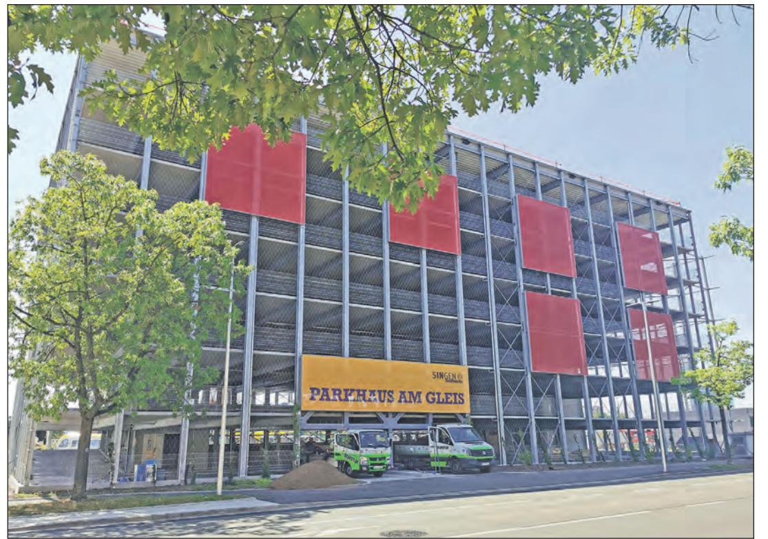
Das neue Parkhaus „Am Gleis“ in der Bahnhofstraße wird am Freitag, 1. Juli, um 14 Uhr offiziell eröffnet und steht dann der Allgemeinheit zur Verfügung. Auf einer Nutzfläche von rund 9.100 Quadratmetern sind in der Nähe zum Ärztehaus und zum CANO insgesamt 324 Stellplätze entstanden.