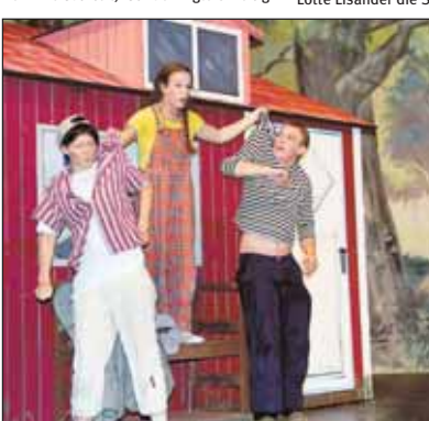
Der Auftakt des Kindertheater-Reigens der neuen Spielzeit 2008/2009 in der Stadthalle Singen ist am Montag, 6. Oktober, um 16 Uhr mit Astrid Lindgrens spannender Kriminalgeschichte „Meisterdetektiv Kalle Blomquist“.

Kultur & Tourismus Singen, Tourist Information (Marktpassage, August-Ruf-Straße 13), oder Stadthalle (Hohgarten 4, Telefon 85-262 oder -504, ticketing.stadthalle@singen.de).