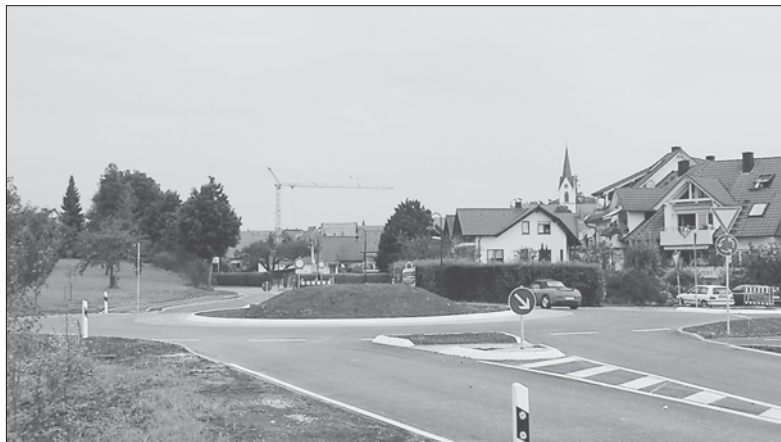
Der Kreisel ist fertig. Nur der Bewuchs fehlt noch.

den kann. Die Umleitung aus Richtung Singen in die obere Lange Straße erfolgt dann über die Schul-, Garten- und Bergstraße. Nach der Kanalverlegung wird im Bereich des Bürgerhauses der Straßenausbau bis zur Schlossstraße und weiter bis zur Bergstraße fortgesetzt. Der Abschluss dieser Arbeiten ist bis Mitte November vorgesehen. Die betroffenen Anwohner werden vom zuständigen Bauleiter informiert, zu welchen Zeiten sie nicht in ihre Grundstücke einfahren können. Die Gemeinde bittet alle betroffenen Bürger um Verständnis für die Behinderungen.