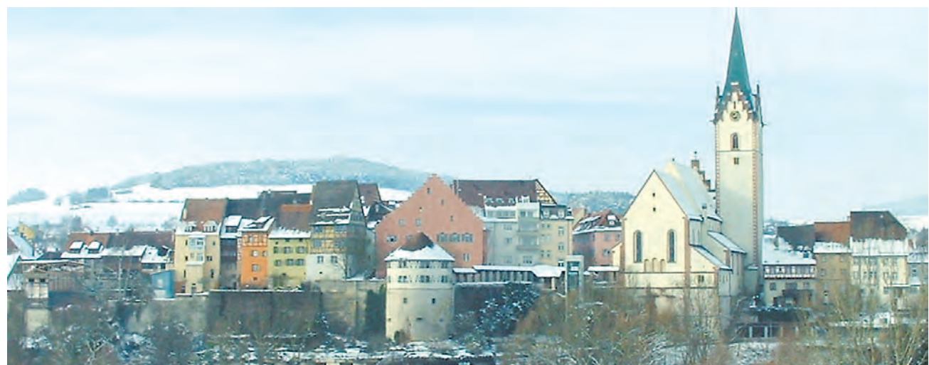
Die düsteren Wolken über der Stadt haben sich verzogen: Engens Finanzen entwickelten sich im laufenden wesentlich erfreulicher als vor einem Jahr erwartet.

Höhere Steuereinnahmen dank deutlich verbesserter Wirtschaftsentwicklung und mehr Zuweisungen führten zu Mehreinnahmen von 981.000 Euro. Geringere Personalausgaben (-69.000 Euro) und Bewirtschaftungskosten (-129.000 Euro) verbessern die Lage zusätzlich und wandeln die Zuführung vom Verwaltungs- zum Vermögenshaushalt von kalkulierten Minus 368.000 auf ein deutliches Plus von 831.000 Euro. Abweichungen gab es auch im Vermögenshaushalt. Der Grund: das 1,5-Millionen-Euro-Darlehen an das HBH-Klinikum wurde nicht notwendig und die Mittel für die Mehrzweckhalle in Höhe von 1,5 Millionen wurden auf 2011 geschoben. Daher erübrigte sich auch eine Rücklagenentnahme von 3,9 Millionen Euro, so dass das Finanzpolster der Stadt