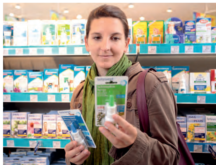
Bei dm in Singen gibt es eine große Auswahl an Produkten rund um die Gesundheit.

In Kooperation mit der niederländischen Versandapotheke Europa Apotheek Venlo bietet dm zudem in vielen Märkten – so auch bei dm in Singen – den Pharma Punkt. Dort können Kunden rezeptfreie und rezeptpflichtige Medikamente sowie weitere Produkte bestellen, die sonst nur in der Apotheke erhältlich sind. Wer am Pharma Punkt bestellt, kann beim Kauf rezeptfreier Gesundheitsprodukte oder apothekenexklusiver Kosmetika 10 bis 40 Prozent gegenüber den üblichen Apothekenpreisen sparen.