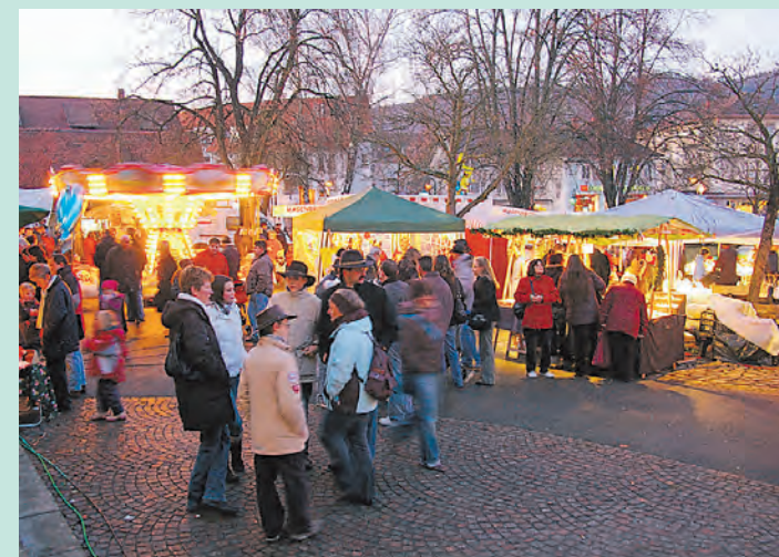
Lichterglanz und ein buntes Angebot mit viel Musik erwartet die Besucher auf dem Gottmadinger Weihnachtsmarkt am Sonntag ab 11 Uhr rund ums Alte Rathaus und auf dem Platz der Hebelschule.