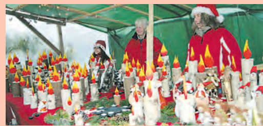
Der Kloosemarkt lockt am Sonntag nach Aach.

Mit Böllerschüssen und Kanonentaufe wird am Sonntag um 11 Uhr die Stadtwache Aach den traditionellen Kloosemarkt auf dem Mühlenplatz in Aach