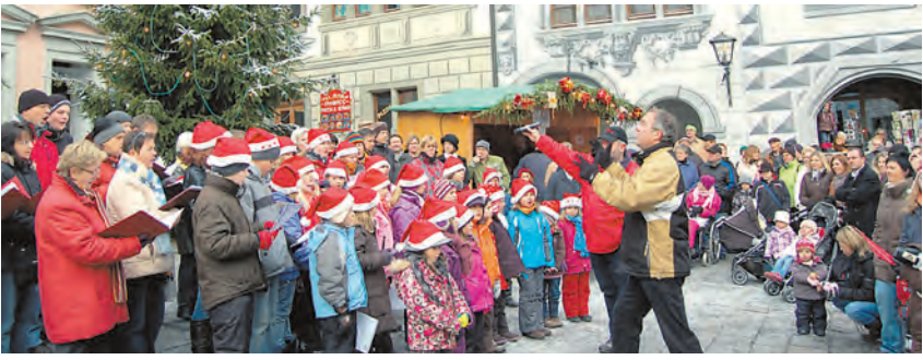
Mit Weihnachtsmelodien eröffneten der Gemischte Chor Neuhausen den Markt.