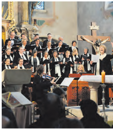
Ein Genuss: Das Adventskonzert in der Stadtkirche. Mehr Bilder unter www.wochenblatt.net