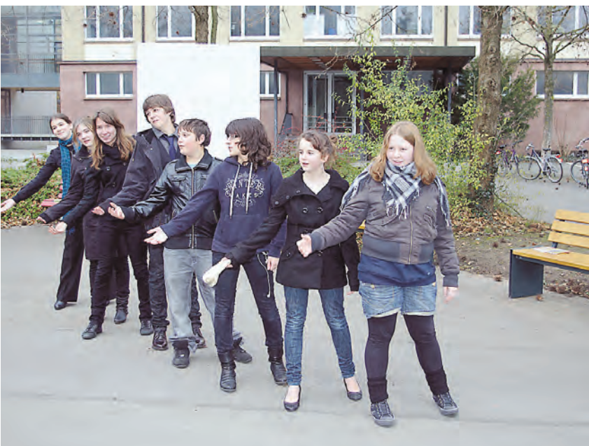
Mit einem Bank-Theater bedankten sich Schüler des Hegau-Gymnasiums für die neue Gemütlichkeit auf dem Schulhof. Sponsoren machten 4 Bänke möglich. Die Stadt Singen spendete zusätzlich eine Tischtennisplatte.

vielfältigen Beziehungen zum Thema Bank mit manchem Hintergedanken verdeutlichte. In Zukunft sollen die Bänke den jeweiligen Zustand der einzelnen Stifterbanken widerspiegeln, wünschte sich OB Oliver Ehret. Er würde die Banken am liebsten gleich zur Instandhaltung der Bänke verpflichten. Sportlich testete er dann selbst die neuen Tischtennisplatten zusammen mit einem Schüler. »Eine Bank von der Bank« kam von den Elternvertretern des Hegau-Gymnasiums als Idee. Sie kam richtig gut an. Mehr Bilder gibt es unter www.wochenblatt.net .