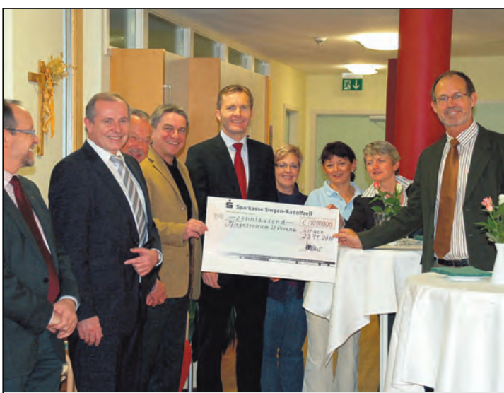
Am Dienstag übergab die Sparkassenstiftung dem Pflegezentrum St. Verena Arlen einen Scheck in Höhe von 10.000 Euro, welcher für den im Sommer dieses Jahres eingerichteten Demenzgarten bestimmt ist. Dies machte die Einrichtung im wesentlichen möglich. Der Garten wurde im letzten Sommer im Zuge des Erweiterungsbau der Tagespflege erschaffen. -pr-