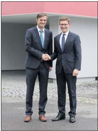
Landrat Zeno Danner und Bürgermeister Marcus Röwer vor dem Rathaus.

arbeitete er unter anderem im Bodenseekreis und für die baden-württembergische Landesregierung in Stuttgart und Brüssel. Bevor er in Konstanz zum Landrat gewählt wurde, war er stellvertretender Landrat im Landkreis Calw.