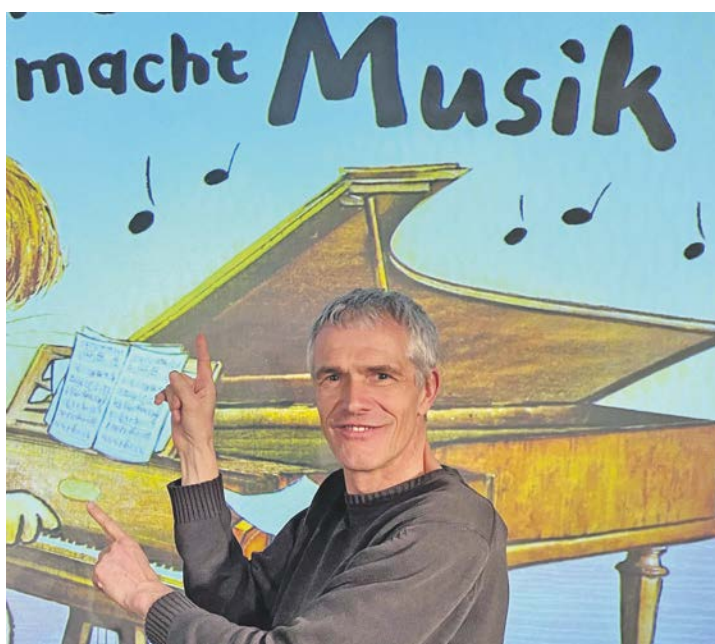
Der österreichische Künstler Marko Simsa tritt als Erzähler auf und schafft es, klassische Musik für Kinder interessant zu machen.

Da sind die 5. Sinfonie mit den berühmten Anfangstönen, die 9. Sinfonie mit der allseits bekannten Europahymne, die Mondscheinsonate mit