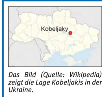
Das Bild zeigt die Lage Kobeljakis in der Ukraine.