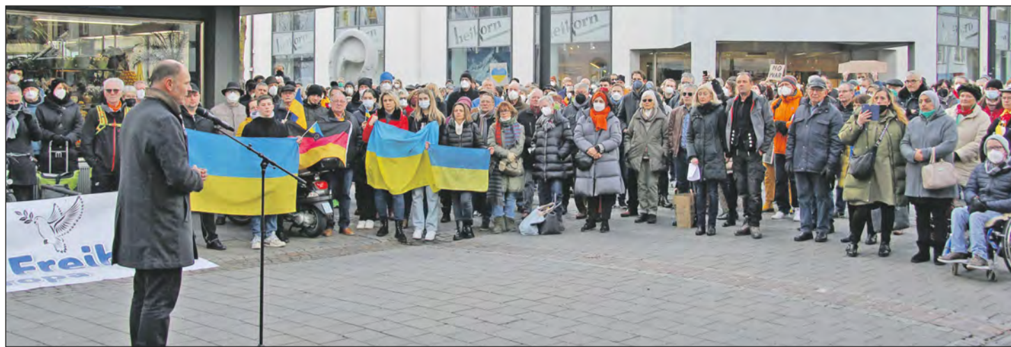
Gut 300 Menschen nahmen in der Fußgängerzone an der Solidaritätskundgebung „Für Frieden und Freiheit in Europa“ und Singens ukrainischer Partnerstadt Kobeljaki teil.

Weitere Informationen unter www.singen.de