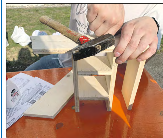
Der Kinder-Workshop „Insektenhotels bauen“ im Jugendhaus Südpol war ein voller Erfolg. Die 15 jungen Leute hatten viel Spaß beim Sägen, Hämmern und Schmirgeln, so dass nach fast drei Stunden ganze elf Behausungen entstanden, die in Zukunft vielen Sechsheimern Unterschlupf bieten werden. Stolz nahmen die Kinder ihre Insektenhotels mit nach Hause.