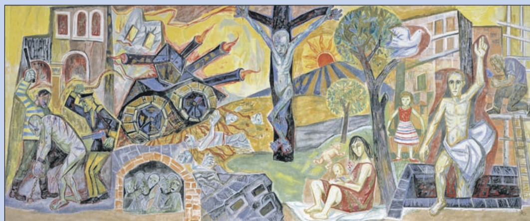
Das einzig erhaltene, monumentale Wandbild „Krieg und Frieden“ von Otto Dix im Ratssaal des Singener Rathauses ist in der Ferienzeit an den Wochenenden für Besucher geöffnet.

Härte“ (Dix) in spätexpressionistischen, d.h. hart gebrochenen Formen und kräftigen Farben dar. Auch glättete er die Leidensge-